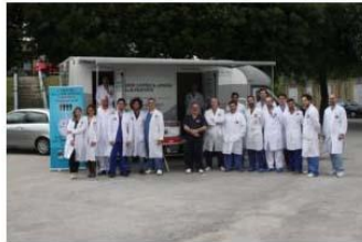
PREVENIRE PER VIVERE: FONDAZIONE PRO E ARPAC INSIEME CONTRO IL TUMORE DELLA PROSTATA