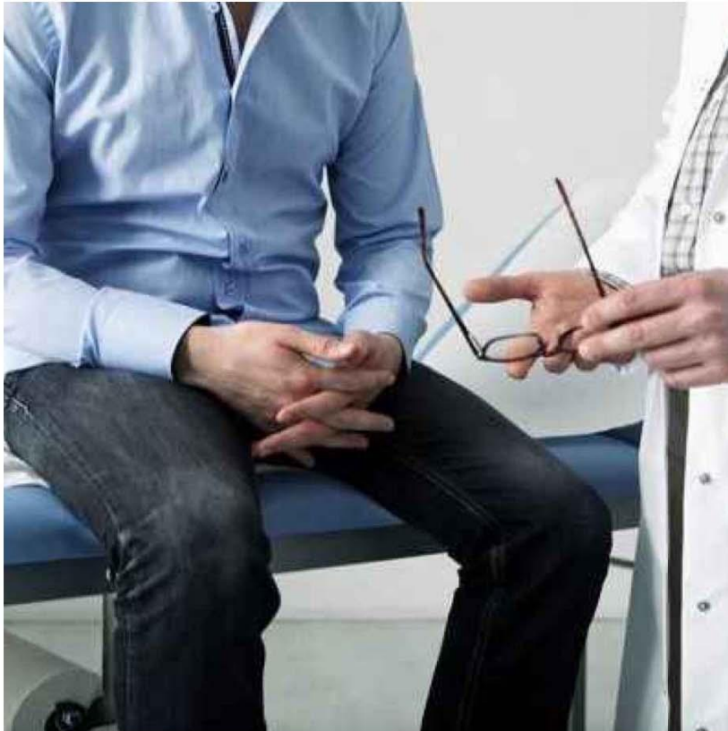
Più informazioni e immagini su: prostata - prevenzione - campania -

L'iniziativa rientra nella campagna di informazione e prevenzione urologica "Prevenire per vivere: la prevenzione..."