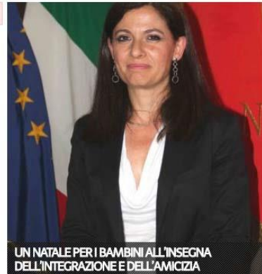
UN NATALE PER I BAMBINI ALL'INSEGNA DELL'INTEGRAZIONE E DELL'AMICIZIA

La Fondazione Pro è quindi a disposizione di tutte le Aziende, Enti e Istituzioni che raccolgono grandi collettività maschili, e che volessero fare richiesta di una tappa del camper nella propria sede. Basta andare sul sito www.fondazionepro.it o info@fondazionepro.it .